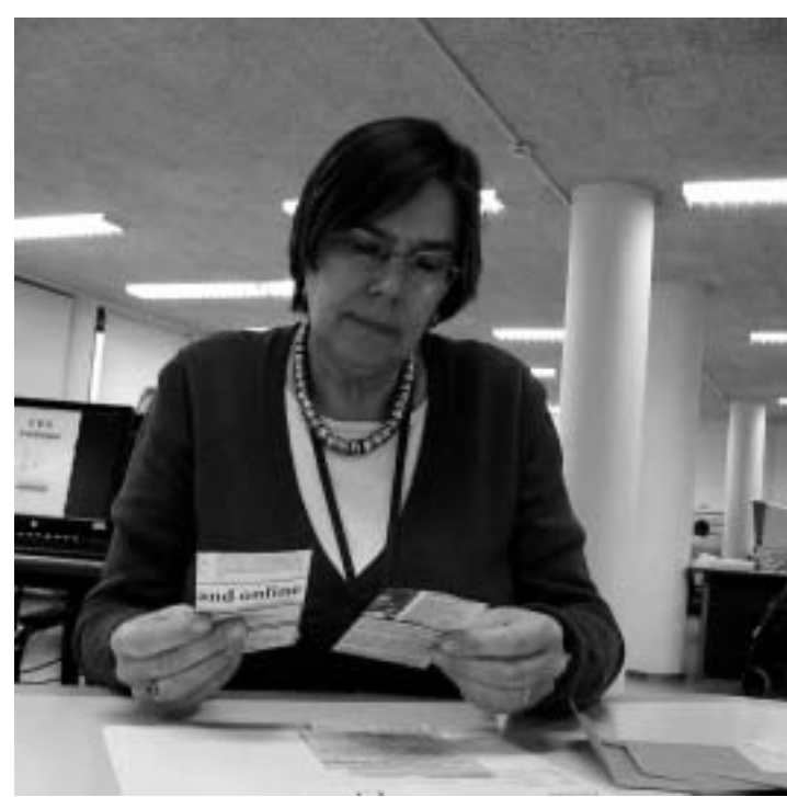
Het blijft puzzelen.

Het gebeurt zelden dat de detective een klant moet teleurstellen. Er is altijd iemand die iets weet, is haar motto. „Ik